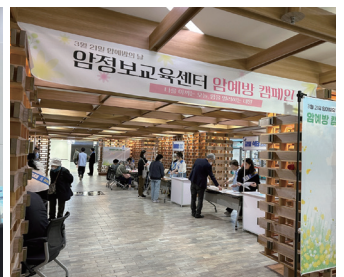
환자·보호자 대상 캠페인