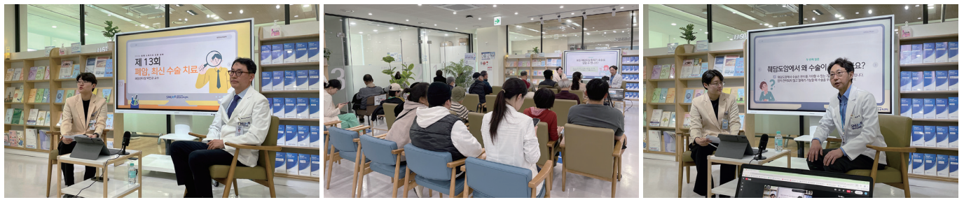
동행 스튜디오 암종별 강좌

된 정보에 대한 수요가 높은 것으로 나타남에 따라, 올해부터 매월 특정 암종을 주제로 한 맞춤형 강좌를 운영하고 있다. 상반기에는 ▲1월 '위암·식도암의 진단 및 내시경 치료' ▲3월 '췌담도암 수술' ▲4월 '폐암 최신 수술 치료' ▲5월 '부인암 진단과 치료' 등 주요 암종을 중심으로 실질적인 치료 및 관리 정보를 제공해 참여자들의 높은 관심을 받았다. 하반기에도 암종별 주제를 중심으로 한 강좌를 이어갈 계획이다. 동행 스튜디오 강좌는 매월 셋째 주 수요일 낮 12시부터 12시 30분까지 서울대학교암병원 1층 동행라운지에서 진행된다. 현장 참여와 함께 온라인 실시간 시청도 가능하며, 온라인 참여자는 강의 시간에 맞춰 접속할 경우 채팅창을 통해 의료진에게 직접 질문할 수 있다. 암정보교육센터는 본 강좌를 통해 암환자와 가족이 필요로 하는 최신 치료 정보와 건강 관리 지식을 보다 쉽게 접할 수 있도록 지원하고 있다.