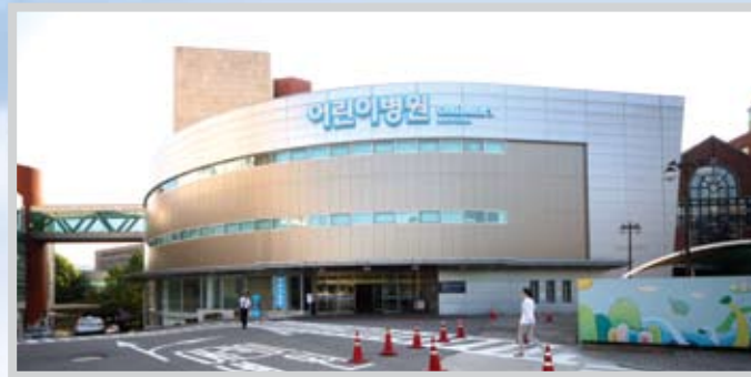
서울대학교어린이병원 SNU Children's Hospital

어린이를 위한 전문병원, 독자적이고 체계화된 전문 시스템으로 소아질환 치료의 새 길을 열다