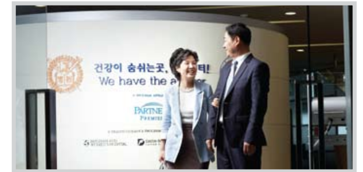
헬스케어시스템강남센터 SNUH Healthcare System Gangnam Center

History of Boramae Medical Center began in 1955 with the establishment of Seoul Municipal Yeongdeungpo Hospital, which in 1987 commissioned its management. With the full financial support from the Seoul Metropolitan Government, we seek to serve the citizens of Seoul with the latest medical technology.