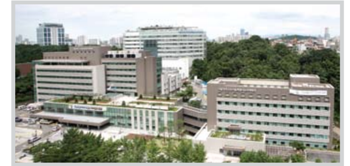
서울특별시보라매병원 SMG-SNU Boramae Medical Center

The Bundang Hospital is a state-of-the-art U-facility, equipped with world-leading electronic medical record. In addition, it is the nation's only hospital specializing in adult and geriatric diseases.