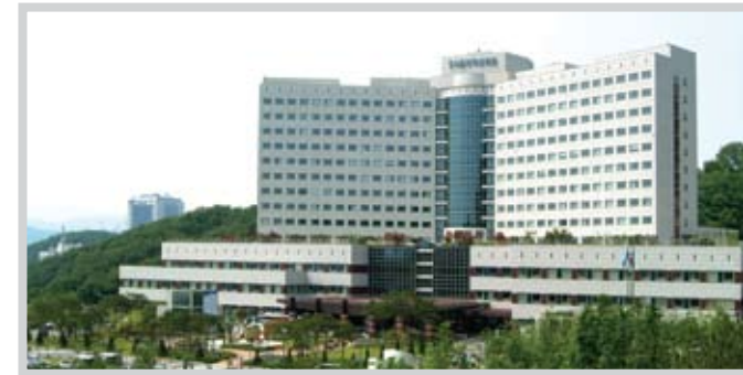
분당서울대학교병원 SNU Bundang Hospital

첨단 디지털 시스템과 풍부한 의료 인프라로 환자를 위한 최선의 서비스를 제공하다