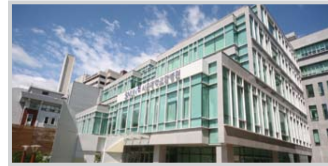
서울대학교암병원 SNU Cancer Hospital

Opened in 1985, SNU Children's Hospital was Korea's very first pediatric hospital. Boasting world-class medical teams and facilities and cutting-edge equipment, it includes a pediatrics department, sixteen sub-clinics, and a variety of disease-based treatment centers.